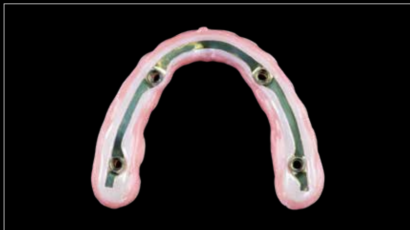
メタルフレームを用いればフルマウスにも対応できます