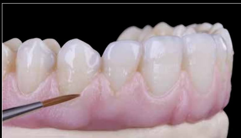
ステイン、ガムポーセレンを付与