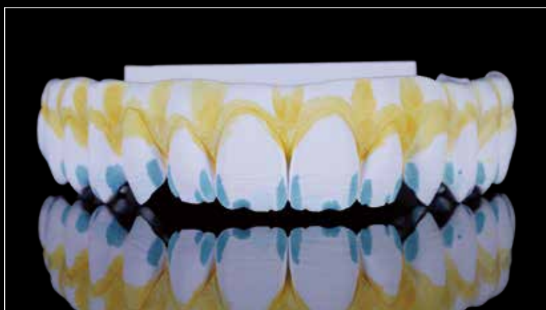
焼結前にカラーリキッドのインサイザルカラーを塗布

GRADUAL-TRIPLEX-TECHNOLOGY は、Zirkonzahnが独自に開発したジルコニア製造技術です。この技術により、曲げ強度 (Flexural Strength)、透過性 (Translucency)、色調 (Colour) が歯頸部から切縁部へとシームレスに変化し、調和することで自然なグラデーションを実現します。