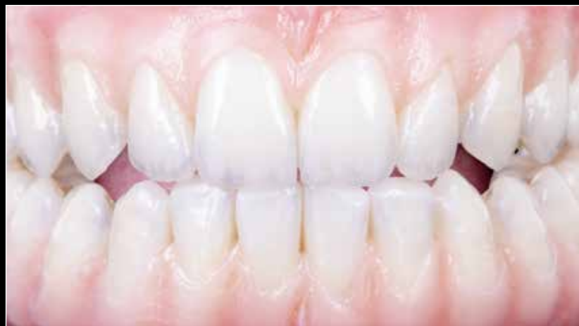
使用ディスク: プレッタ3ディスパーシブ A2 95H25